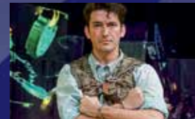
הודיני (לגילים 8-12)