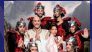
מולאן (לגילים 6-12)