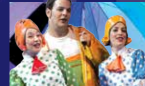
מחסן השטוזים של דחיה (לגילים 3-6)