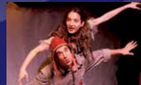
פטר והזאב (לגילים 4-8)