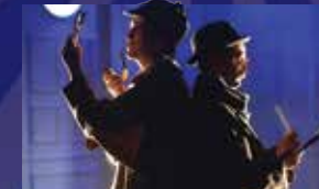
שרלוק הולמס (לגילים 8-12)