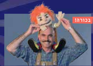
הארגז של ביאליק (לגילים 3-6)