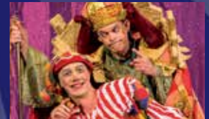
ליצן החצר (לגילים 5-9)

לרכישת כרטיסים: *6437 (שלוחה 9) • או באתר התיאטרון: porat-theater.co.il