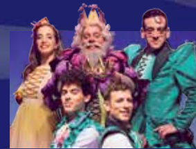
זרעים של אמה (לגילים 5-9)

כ-40 הצגות ב-3 ימים • 9-11 במרץ פעילות חוצות במשכן לאמנויות הבמה- הכניסה חופשית!